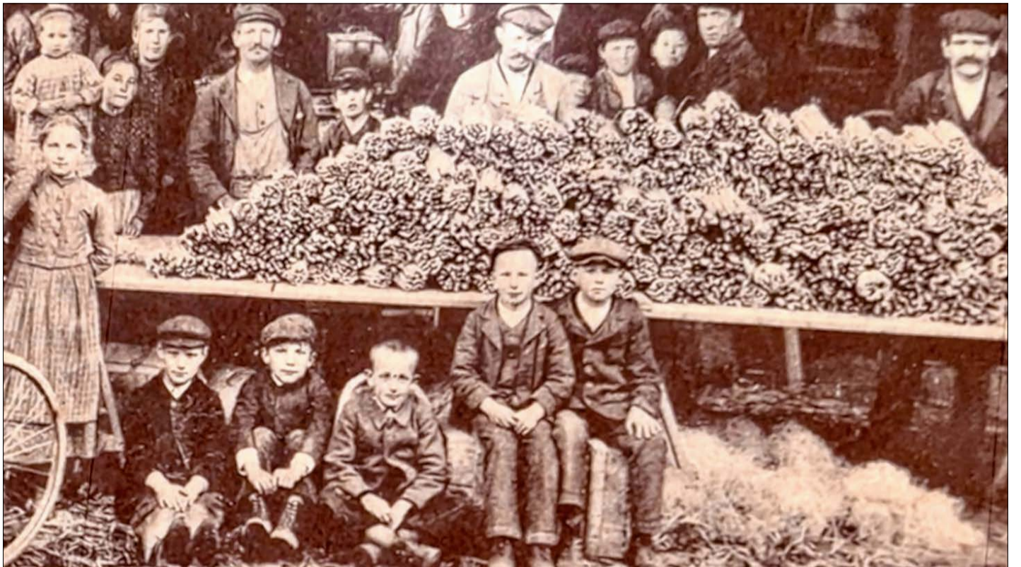
Schon früh war Hoerd die Spargelhauptstadt des Elsass. 1880 gab es hier bereits etwa 40 Spargelerzeuger. Fotos wie dieses im „Musée de l'asperge et des traditions locales“, das 2020 eröffnet wurde, zeugen von der langen Spargeltradition.

Telefon: 07851/9948090 Mail: gerd.birsner@reiff.de